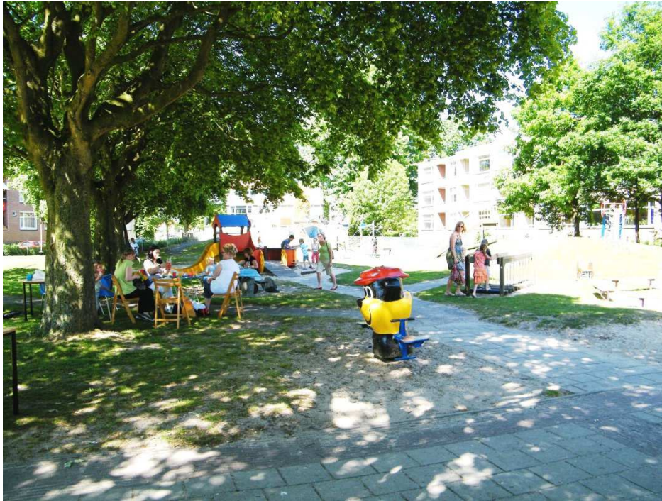
Ontspanning voor groot en klein in speeltuin Weidedorp, Curaçaostraat

Drie van de speeltuinen zijn openbaar toegankelijk. Speeltuin Fantasiadorp in de Hasseler Es, nabij het Kulturhus en het winkelcentrum, is vanaf de aanleg in 2007 (als opvolger van voorheen speeltuin Hoeseldorp) openbaar geweest.