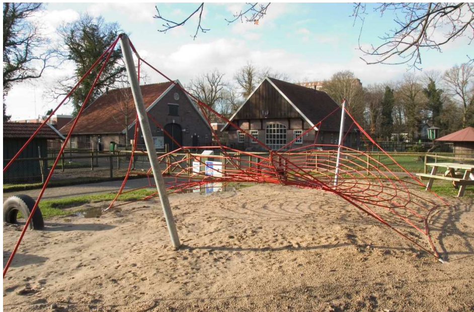
De speelplek bij de kinderboerderij