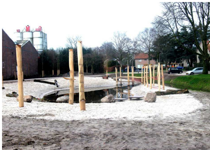
Waterspeelplek Omloopleiding bij speeltuin De Breemars

In het Watertorenpark tenslotte, wordt binnenkort een nieuwe speelplek aangelegd, als openbare opvolger van de opgeheven speeltuin Tweekelerwegkwartier. Het inrichtingsvoorstel is tot stand gekomen in overleg met het voormalig bestuur van de buurt- en speeltuinvereniging Tweekelerwegkwartier.