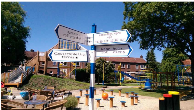
Speeltuin 't Lansink, Twijnstraat (foto speeltuin en buurtcentrum 't Lansink)

Zeven van de Hengelose speeltuinen vallen onder beheer van wijkcentra of speeltuinverenigingen. Beleidsmatig gezien vallen zij onder het welzijnswerk. Anders dan bij de openbare speelplekken, vindt het spelen plaats onder toezicht en gaan de poorten 's avonds dicht. Beheer en onderhoud worden uitgevoerd door de beheerder. Speeltuin 't Lansink neemt een aparte plaats in. Deze speeltuin heeft zich erop toegelegd om – mede - een belangrijke functie te vervullen voor kinderen met een beperking en heeft daarmee ook een regionale aantrekkingskracht. Het feit dat deze speeltuinen 's avonds, en deels ook in het weekend, niet toegankelijk zijn heeft als nadeel dat er op die tijden minder speelmogelijkheden in de buurt zijn. Het spelen onder toezicht heeft echter ook voordelen: er kan gebruikt gemaakt worden van een breder aanbod aan toestellen, bijvoorbeeld toestellen met een zwaai- of draaifunctie, omdat de volwassenen een oogje in het zeil houden. Ook kunnen meer toestellen gebruikt worden die in de openbare ruimte te gevoelig zijn voor vandalisme. Denk daarbij aan toestellen met scharnieren, kwetsbare verbindingen of draaiende onderdelen.