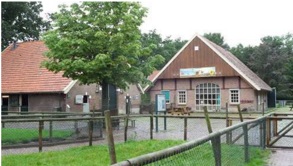
Kinderboerderij 't Weusthag, van Alphenstraat

Bij de kinderboerderij ligt een speelplek, die toegankelijk is gedurende de openingstijden. Mede met het oog op de toekomstige vernieuwingen in de wijk Hengelose Es is de kinderboerderij een kansrijke plek voor het ontplooiën van initiatieven om de speelmogelijkheden te verruimen. Elders in het land zijn voorbeelden te vinden van interactief spel met water-, wind- en zonne-energie. Ook de groene ruimten bieden mogelijkheden voor natuurlijk spel. De educatieve functie en de speelfunctie van de kinderboerderij kunnen elkaar op deze manier wederzijds versterken.