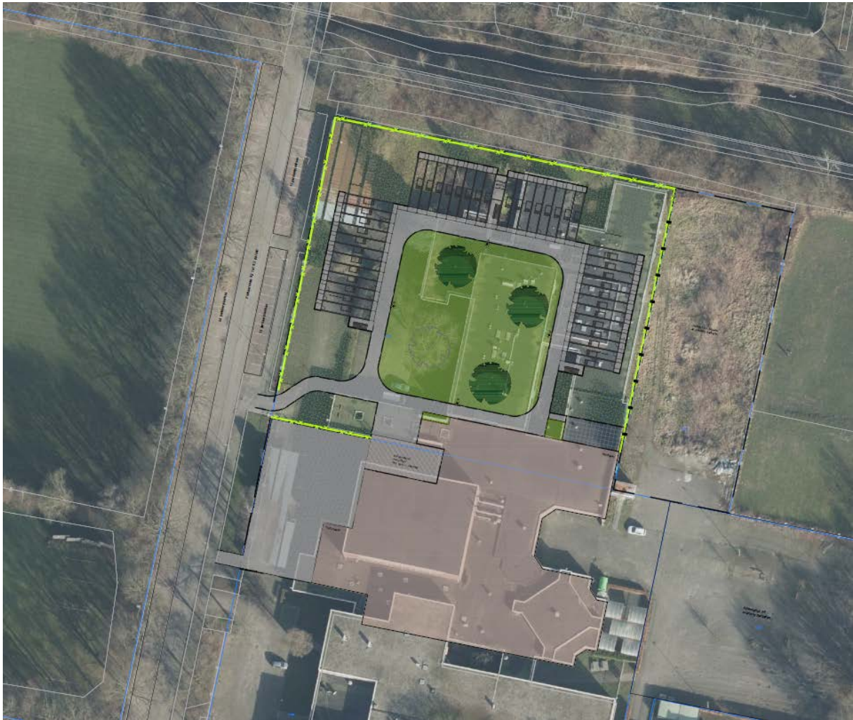
Figuur 2: Sfeerimpressie tijdelijke woonunits Sportlaan Driene