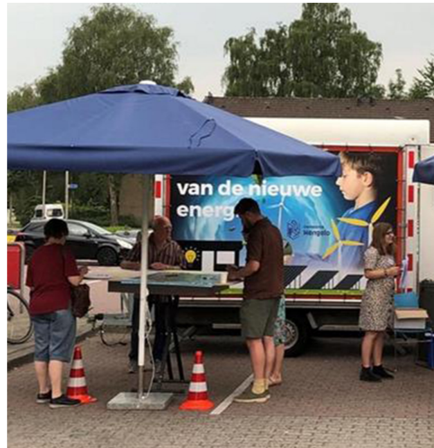
Karavaan van de Nieuwe Energie.