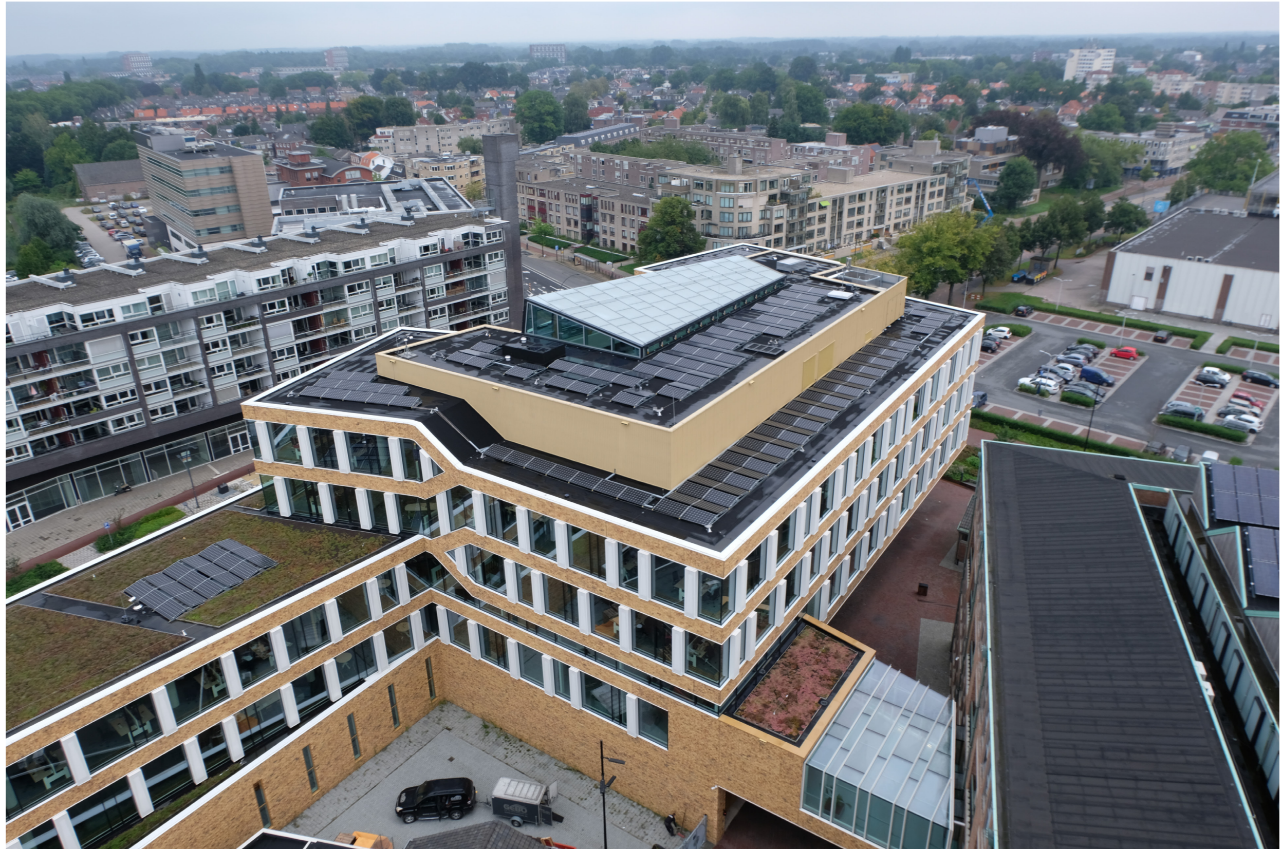
Zonnepanelen op het dak van het nieuwe stadhuis