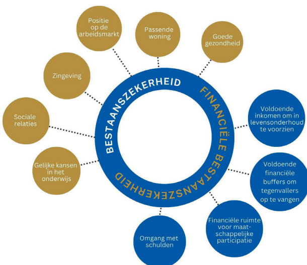
Afb. 2: Elementen (financiële bestaanszekerheid)

Wij doen er, binnen onze mogelijkheden, alles aan om onze inwoners een zeker bestaan te bieden. Bestaanszekerheid staat aan de basis van een effectieve aanpak binnen het gehele sociaal domein. Armoede en schulden kunnen perspectief op een beter bestaan in de weg staan. Het werkt verlamdend en neemt ontwikkelingsruimte in beslag. Om perspectief te bieden aan inwoners met een laag inkomen is het daarom noodzakelijk om armoede en schulden aan te pakken, maar ook om oog te hebben voor de algehele situatie. Het herstellen van bestaanszekerheid is een basis om gezonder te kunnen leven en mee te kunnen doen in de samenleving. 2