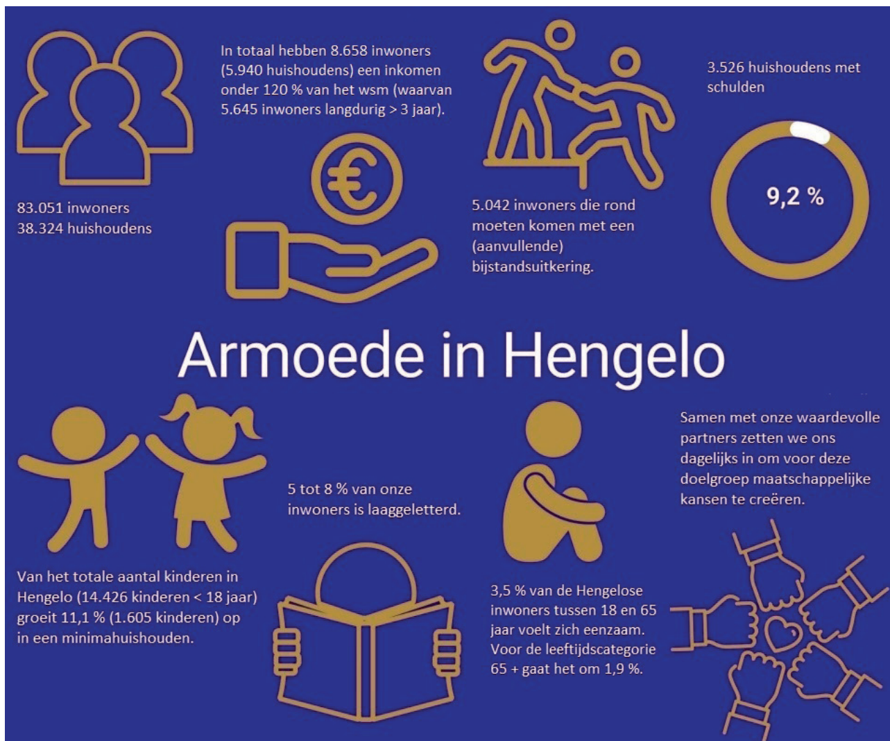
Afb. 1: De meeste actuele cijfers van Hengelo

Werken aan een bestaanszekere toekomst voor onze inwoners, brengt een breed scala aan zowel uitvoeringstaken als beleids- en strategische opgaven met zich mee. In dit beleidskader worden de hoofthema's en uitgangspunten benoemd. Deze hoofthema's en uitgangspunten geven de komende periode richting aan verschillende opgaven. Wij stellen een uitvoeringsplan vast om de uitvoeringsgerichte taken te borgen. De gemeenteraad zullen we daarover informeren. We kijken voortdurend waar extra inzet nodig is en waar nodig stellen we bij. Mochten zich relevante ontwikkelingen voordoen die het nodig maken dat het beleidskader wordt bijgesteld, leggen we dit voor aan de gemeenteraad.