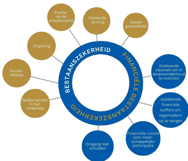
Afb. 2: Elementen (financiële bestaanszekerheid)

Wij doen er, binnen onze mogelijkheden, alles aan om onze inwoners een zeker bestaan te bieden. Bestaanszekerheid staat aan de basis van een effectieve aanpak binnen het gehele sociaal domein. Armoede en schulden kunnen perspectief op een beter bestaan in de weg staan. Het werkt verlamdend en neemt ontwikkelingsruimte in beslag. Om perspectief te bieden aan inwoners met een laag inkomen is het daarom noodzakelijk om armoede en schulden aan te pakken, maar ook om oog te hebben voor de algehele situatie. Het herstellen van bestaanszekerheid is een basis om gezonder te kunnen leven en mee te kunnen doen in de samenleving. 2